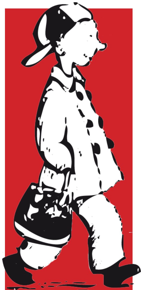
Illustration: Eva Eriksson

Efter Eva Erikssons bok Stures nya jacka