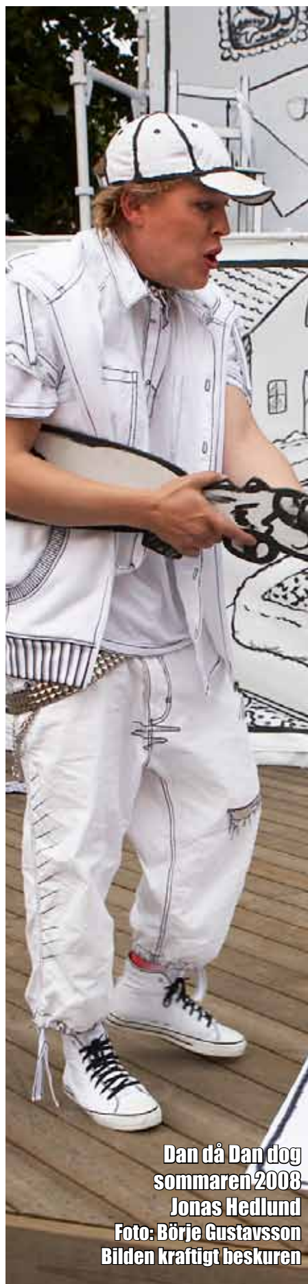
Dan då Dan dog sommaren 2008 Jonas Hedlund Bilderna kraftigt beskuren

Under 2009 har vi genomfört 8 forumspel. Det är mycket färre än vanligt men 2009 har också varit ett år präglad av en ekonomisk kris. Våra uppdragsgivare har varit allt ifrån kommuner, landsting och privata bolag.