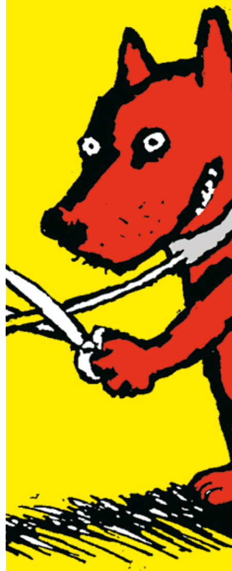
Dan då Dan dog Illustration. Ulf Lundkvist